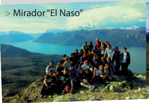
> Mirador "El Naso"

de un almuerzo con una vianda previamente preparada en Vulcanche. Desde este mirador el sendero sigue a través del filo que conduce directo hasta la base del pedrero, donde desaparece el bosque de lengas. Nuestro objetivo máximo es la cumbre, la parte más alta de esta caminata ofrece fantásticas vistas del Volcán Lanín, el Tronador y la sucesión de volcanes chilenos. Solemos tener la visita de los cóndores, planeando no tan lejos de nuestras cabezas. Bajamos por el mismo camino. Demoramos siete horas en total.